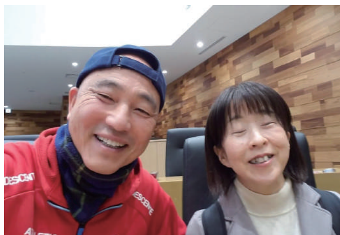
初めての議場で、妹と初ツーショットです。